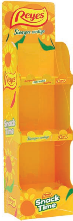
EXP. SNACK GRANDE