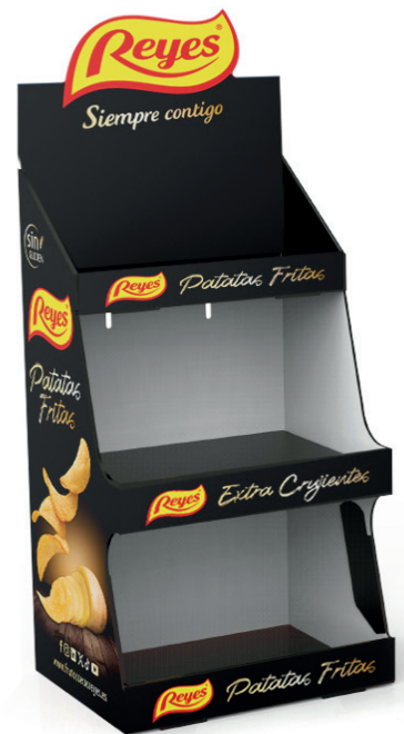
EXP. PATATAS NEGRO