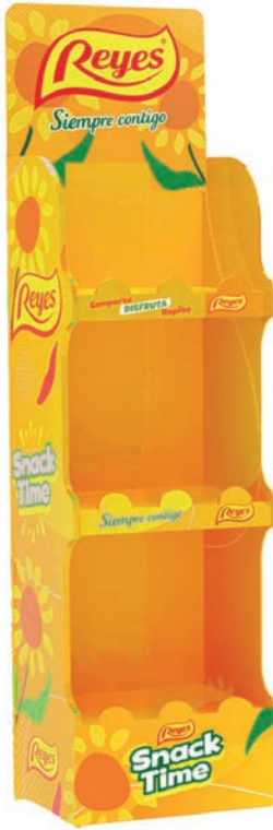
EXP. SNACK GRANDE