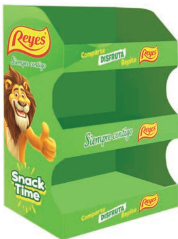
EXP. SNACK SOBREMESA