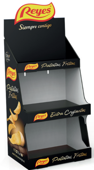
EXP. PATATAS NEGRO