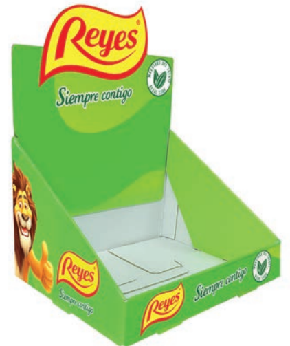
EXP. SOBREMESA CARTÓN