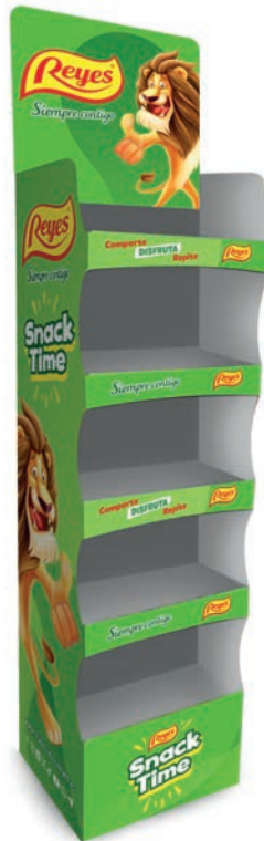
EXP. SNACK LEÓN